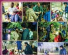
10- Street Ministry