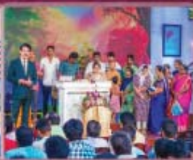
3- Cancer Patients