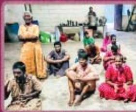
7- Mentally challenged