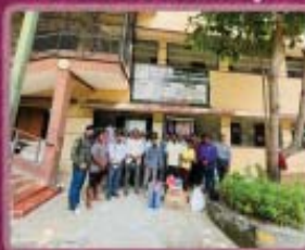
13- Oldage Home