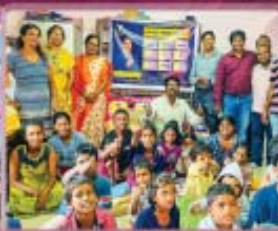
2- Parent Less Home