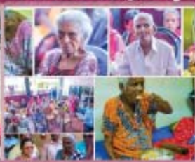
8- Sick Peoples Home