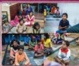
5- Childrens Orphanage