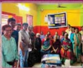
6- Old Womens Home