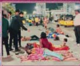
15- Street Ministry