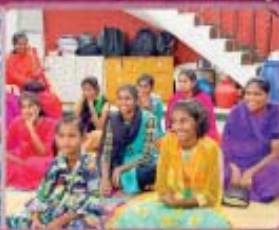
12- Girls Home