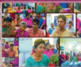
14- Womens Sick Home