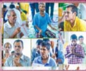
9- Intellectual disability