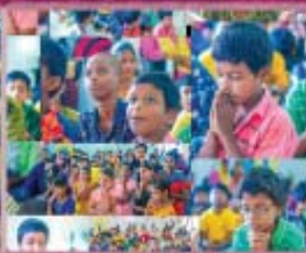
11- Childrens Care Home