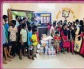
4- Foster Home