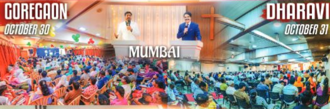
GOREGAON OCTOBER 30