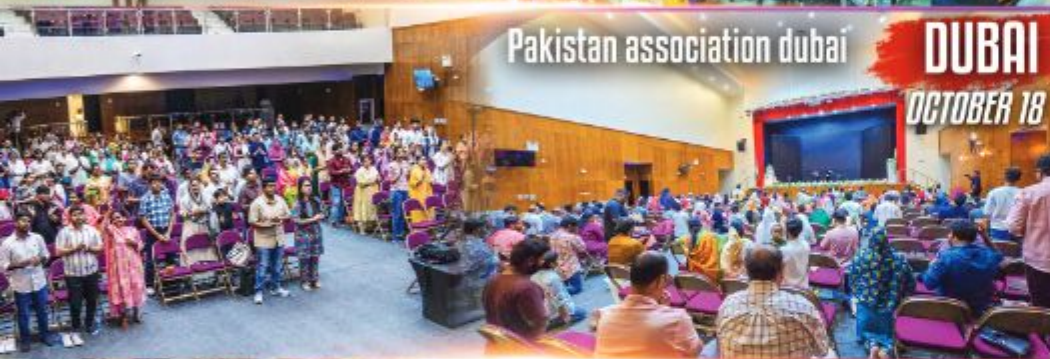
Pakistan association dubai