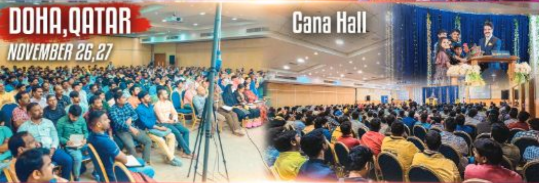
DOHA, QATAR NOVEMBER 26, 27