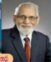
రీ. డి. ఎ. మారుధారు