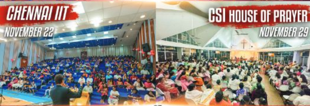
CHENNAI IIT NOVEMBER 22